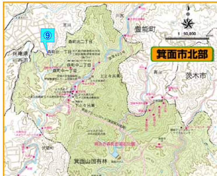
災害時相互連絡配水管の既協定内容及び今後締結予定