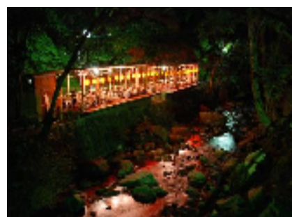
夜も営業しています。団体さま大歓迎！