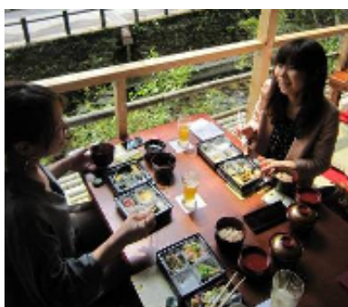
おいしい料理に話が弾みます