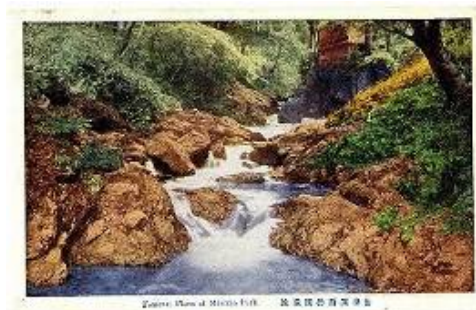
当時の箕面川床の絵はがき

2年前、阪急箕面駅から箕面大滝へ続く滝道の活性化を目的として、箕面の特産品を使ったお弁当や甘味などが楽しめる「箕面川床」を復活させました。