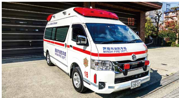
高規格救急自動車

箕面市消防本部の新たな戦力として、緊急時に充分活躍できるように態勢を整えていきますので、引き続き、消防活動へのご理解とご協力、並びに救急車の適正利用にご協力をお願いいたします。