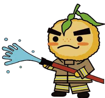
箕面市PRキャラクター 滝ノ道 ゆずる