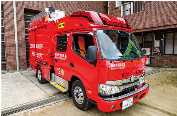
消防ポンプ自動車

消防本部では消防ポンプ自動車1台及び高規格救急自動車1台を更新整備しました。また、箕面ライオンズクラブから軽可搬ポンプ積載車1台の寄贈を受けました。