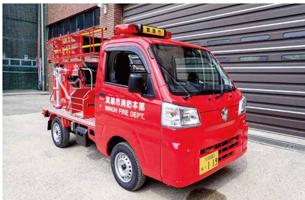
軽可搬ポンプ積載車

消防ポンプ自動車は、小型なボディー形状ながら600ℓの水を積載しており、その機動性を活かし、狭隘な道路にも進入することができます。火災現場に到着すると、直ちに積載水を使用して放水することができます。状況に応じてCAFS(圧縮空気泡消火装置)で消火することもできます。