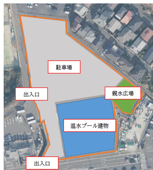
図：イメージパースおよび施設配置図等