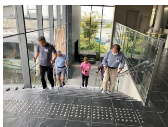
(箕面シニア塾スポーツコース)