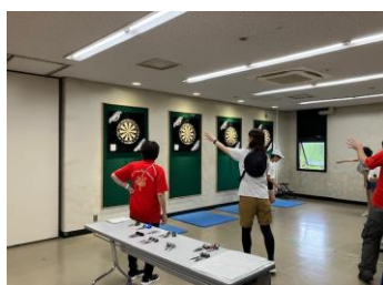
(スポーツカーニバル体験会)