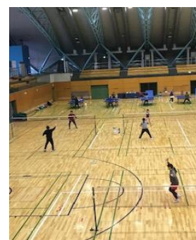
(スポーツのつどい)