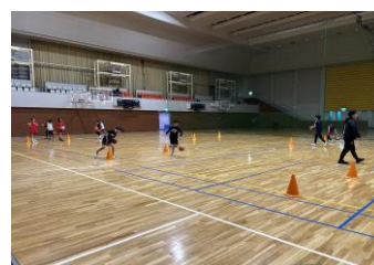
(スカイアリーナ&第二総合)