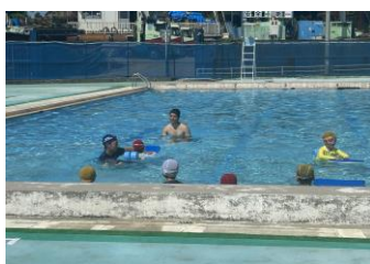
(子ども向けスポーツ教室)