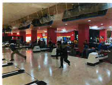
(箕面シニア塾スポーツコース)