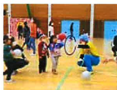
(スポーツカーニバル体験会)