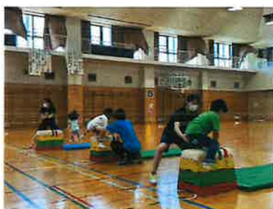
(子ども向けスポーツ教室)