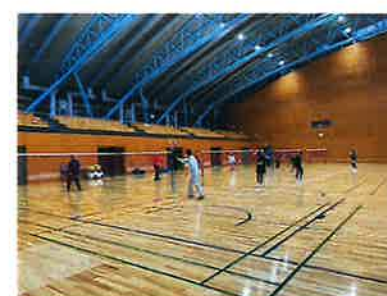
(スポーツのつどい)