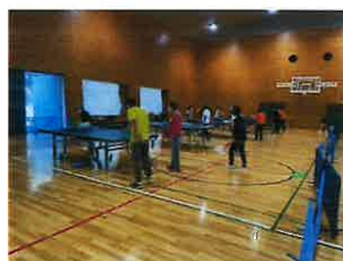
(スカイアリーナ&第二総合)