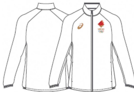
←ボランティアスタッフ用 公式ウインドジャケット

いずれも現在、募集中で、募集期間は、応援演舞が令和2年1月31日(金曜日)まで、ボランティアスタッフが令和元年12月27日(金曜日)までです。なお、ボランティアスタッフには聖火リレー公式ウインドジャケットを無償でお渡しします。