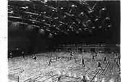
(スカイアリーナ つどい)