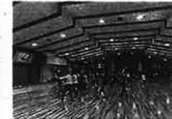
(箕面シニア塾スポーツコース)