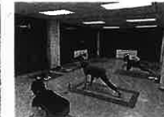
(武道館・女性向け教室)