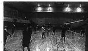
(大人のスポーツ・トライアル事業)

市民の心と体の健康を願い、年齢や障がいの有無に関らず一人一人のライフスタイルに応じて楽しめる「スポーツによる健康づくり」を更に推進して参ります。