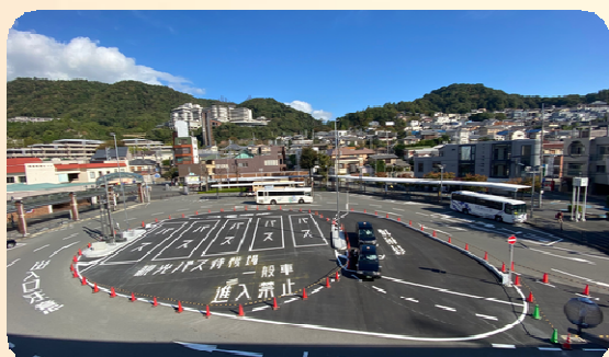
ワンウェイ滝道観光