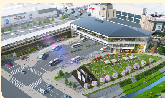
鉄道延伸後のまちづくり