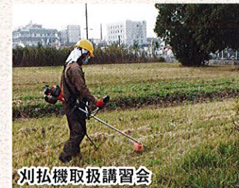
刈払機取扱講習会