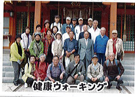
健康ウォーキング