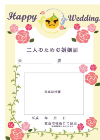
二人のための婚姻届