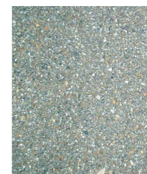
自然色アスファルト舗装の表面