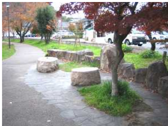
自然素材にて構成された休憩スポットのイメージ。(奈良県生駒郡斑鳩町竜田川)