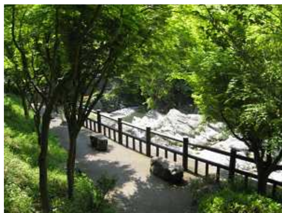
周辺の自然にとけこんだ休憩スポットのイメージ(奈良県生駒郡平群町馬淵沢)