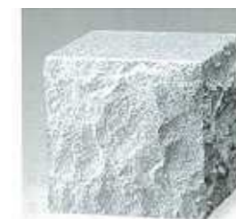
質量:78kg サイズ:□300×H300 本体:遊影石(白) 磨砕(上面本磨き)仕上