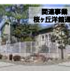
関連事業 桜ヶ丘洋館通り