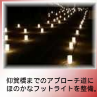
仰賢橋までのアプローチ道にほのかなフットライトを整備。