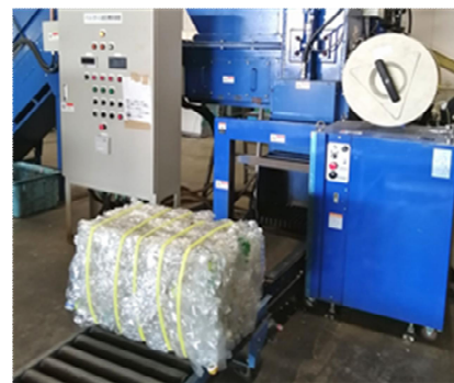
ペットボトルのボール