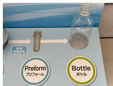
プリフォーム及びボトル