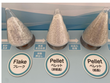
フレーク及びペレット