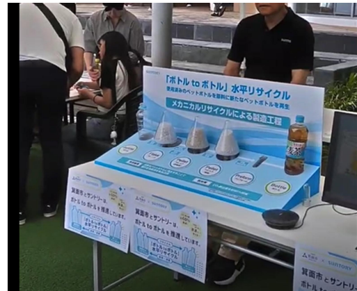
ボトル to ボトルの普及