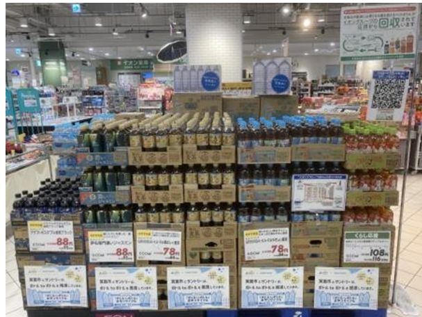
SDGs スタンプラリーでの啓発