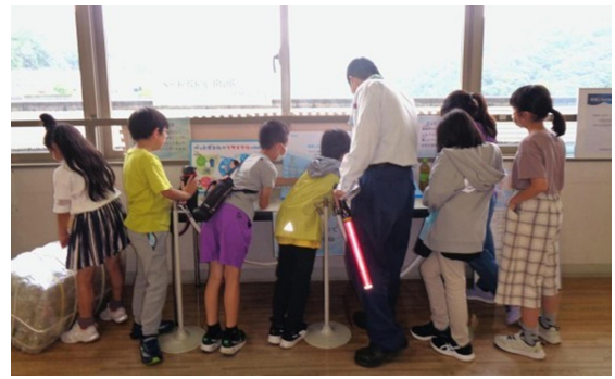
小学生社会見学の様子

令和7年6月15日には、みのおキューズモールにてサントリーホールディングス、サントリーフーズ、みのおキューズモールと「ペットボトルのラベルの塗り絵体験とサントリーサンバースのシーズン報告会」を共催し、約200人の参加者が塗り絵体験に来場しました。塗り絵体験では、参加者にペットボトルの分別の大切さを楽しく伝えることができました。