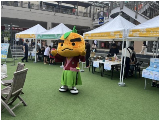
塗り絵体験会場の様子

令和7年10月3～5日には、イオンスタイル箕面店の「SDGs スタンプラリーイベント」でもイオンスタイル箕面店とサントリーホールディングスの協力のもとに「ボトル to ボトル」の啓発に努めました。