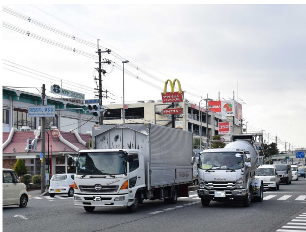
西南小学校前の国道 171 号の様子

今回の見直しにより、全市域において投票所までの距離が長い、幅の広い道路を越えなくては投票所へ行けないなど、投票所までの移動の問題は、大幅に改善されます。