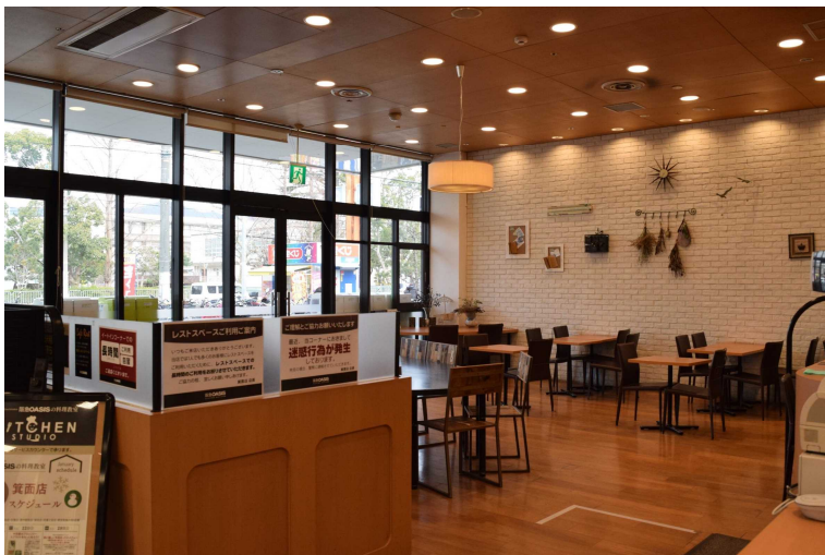
阪急オアシス箕面店「レストスペース(イートインコーナー)」

阪急オアシス箕面店に投票所を設置することで、有権者の移動の負担が大幅に軽減されます。また、買い物ついでに投票ができるようになり、投票の利便性が格段に向上します。