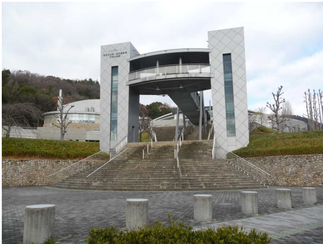
箕面市立第一総合運動場 市民体育館 スカイアリーナ