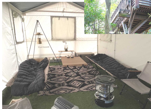
【キャビンテント内部】※写真の内装品は、すべて有料レンタル品