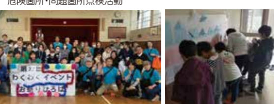
わくわくイベントお祭り広場