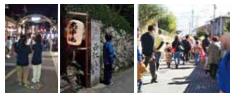
納涼の夕べ 天狗祭り こどもみこし