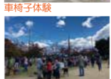
車椅子体験 食べ物コーナー