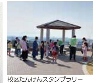
校区たんけんスタンプラリー