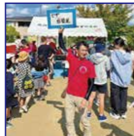
とよみなフェスタ

これからも諸団体と連携して、地域の安心・安全・笑顔のための活動を続けてまいります。