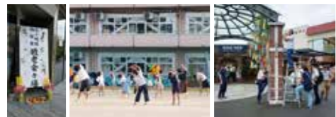
敬老会 ラジオ体操 七夕飾り