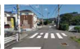
危険箇所・問題箇所点検活動