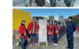
危険箇所・問題箇所点検活動・簡易補修