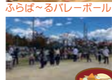
受付 あそびコーナー