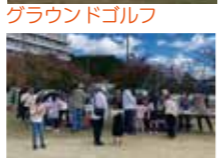
グラウンドゴルフ 豚汁・豚まん