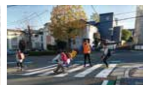
登下校時見回り活動