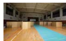
避難所お泊り体験