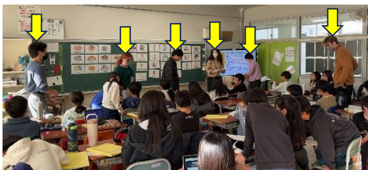
5・6年生の英語授業の様子

ALTによるスピーキング・ ライティングのチェック → 「正しく」「使える」英語