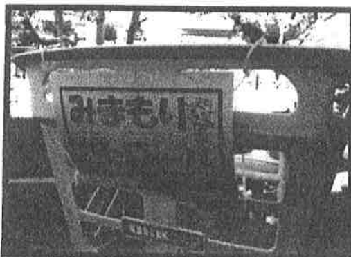
繰り返し使える結束バンド使用