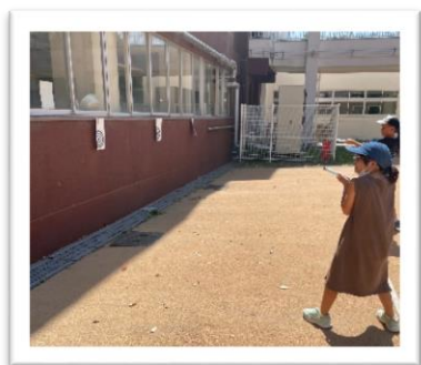
○理科(空気でっぼう・4年)