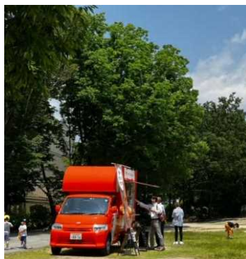
多目的エリアでは、キッチンカーの出店が可能 (イメージ)