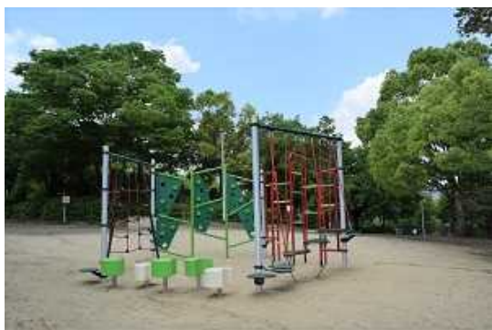
アンケート調査で人気の高かった遊具を新たに設置