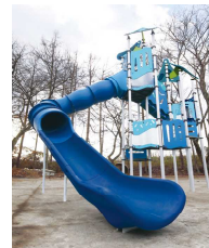
プレイボードワンダー