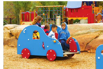
キャンピングカー