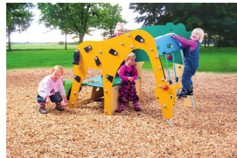
ジャングル アドベンチャー