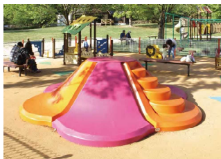
ちびっこマウンテン