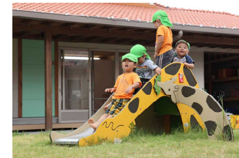
ちびっこスライダー