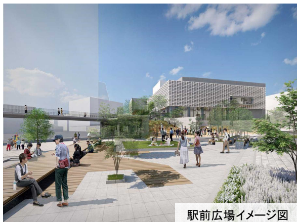
駅前広場イメージ図

駅から周辺施設にアクセスする際の玄関口となる施設で、約 5,000 m 2 の空間の中に地区内デッキ(2階部分)と駅前広場を整備します。素材感を活かした飽きのこないデザインとし、特に駅前広場は、芝生やファニチャーにより市民の憩い・交流の場となるよう工夫します。