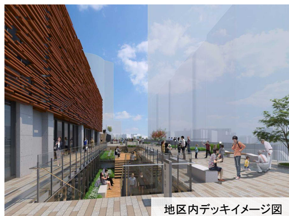
地区内デッキイメージ図