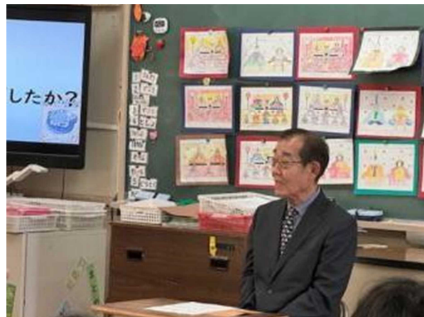
オーサービジットの様子 中小学校