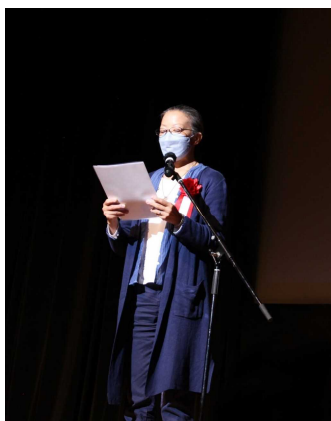
第 11 回 作品賞