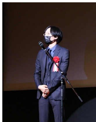
第 11 回 ヤングアダルト賞