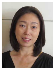
かあちゃんからのコメント