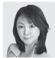
藤村 あきこ 24時間ペットショップを無くし 日本初のペット防災本を出版。 テレビ放送作家として動物福祉を手がけ福祉の ヒアリングや動物愛護法改正推進に参画。24時間 ペットショップを無くし殺処分を減らす活動に貢献。 2022年参議院選挙比例区で出馬12万票を超えた。 日本動物福祉助成会代表理事。