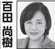
ありもとかおり 日本保守党 事務総長 ジャーナリスト