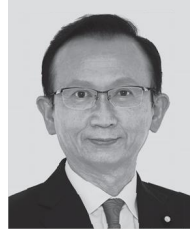
塩田 ひろあき 現1 党中央幹事、同東京都本部副代 表、同国土交通部会長代理、参 院災害対策特別委員長。参院議 員1期。秋田大学卒、63歳。