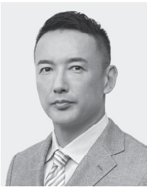
参議院議員 山本 太郎 (れいわ新選組 代表)