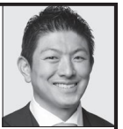
参政党代表 神谷宗稔