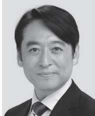
平木 だいさく 現2 党関西方面本部部長、同経済産業 部会長、元復興副大臣、元経産 大臣政務官。参院議員2期。経 営学修士。東京大学卒、50歳。