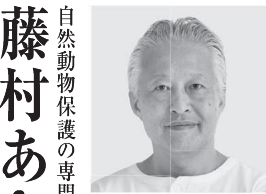
大西 つねき 持続不可能な金融システム、 拝金資本主義を根こそぎ変える。 1964年2月29日生まれ。東京都出身。 上智大学外国語学部英語学科卒業。フェア党代表。 2017年9月第48回参議院選挙比例区5区立候補。 2019年7月第25回参議院選挙比例区立候補。 2021年10月第49回衆議院選挙比例区14区立候補。