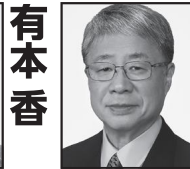
うめはらかつひこ 日本保守党 特別顧問 元仙台市長