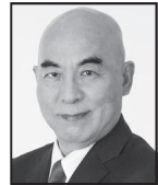
ひやくたなおき 日本保守党 代表 ベストセラー小説『永遠の0』作者