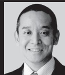
参議院議員 浜田 聡

NHK党の党首である立花孝志は、テレビと新聞といったオルドメディアの度重なる偏向報道・虚偽の報道によって殺される時代になった。インターネットで真実を拡散できる時代になった。オルドメディアの報道によって、特定の政治家の政治生命を絶つことも、立花孝志が殺されたように、命そのものを奪うことも可能なほど、未だに影響力は強大です。政治は正に命がけです。NHK党はオルドメディアの暴走を許しません。オルドメディアによる被害者を守り、国民の知る権利を守るために、命がけで真実を発信し続けます。