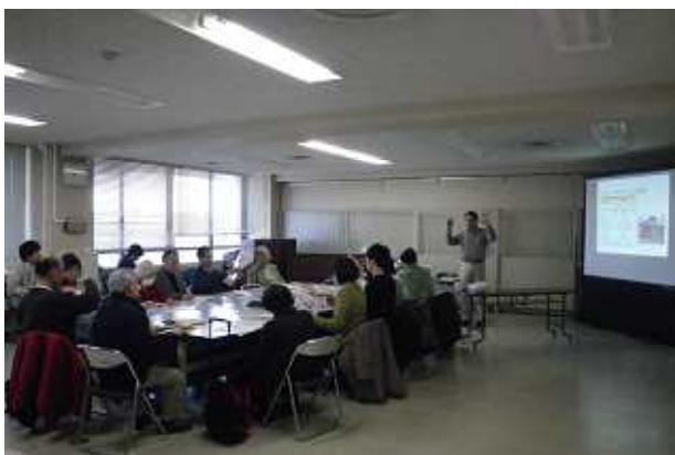
情報交換会（平成24年1月12日）