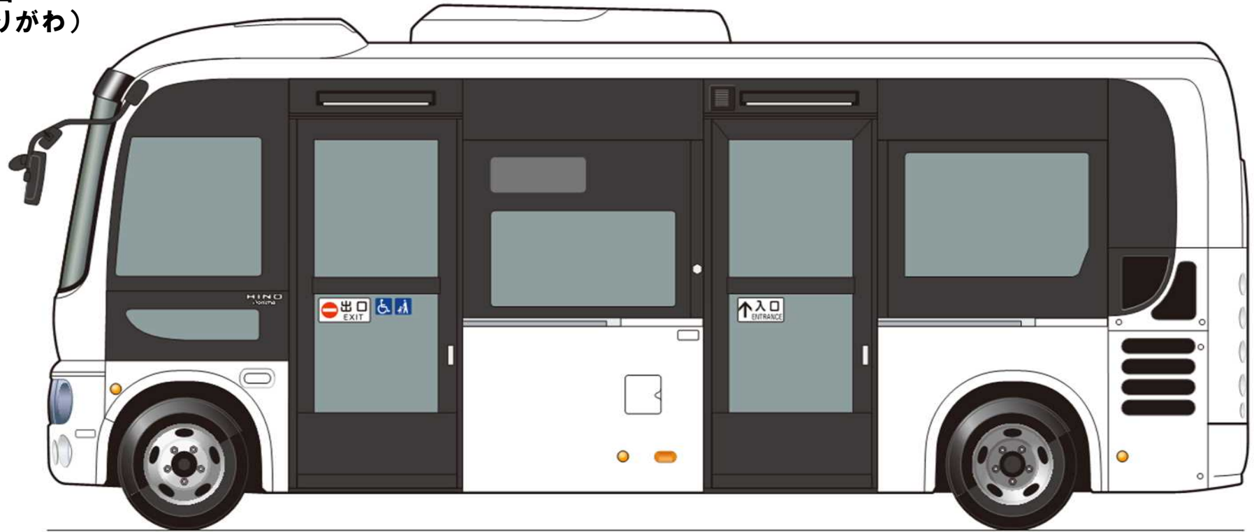
ひだりそくめん ●左側面 (ひだりがわ)