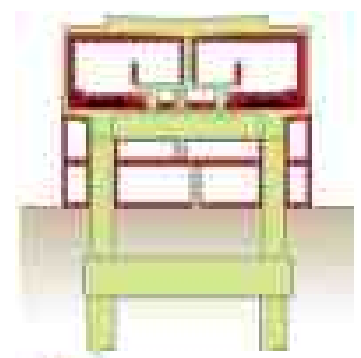
■ 箕面市施工(構造物) ■ 北大阪急行電鉄施工(内装・設備)