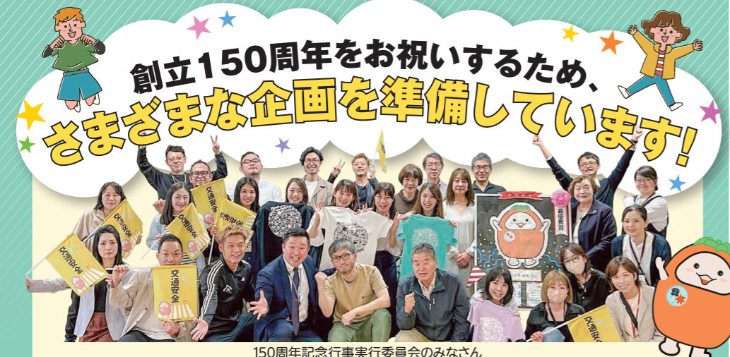
150周年記念行事実行委員会のみなさん