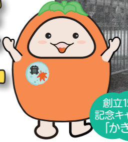
創立150周年記念キャラクター「かきみん」

↑平成24年の伐採まで、138年にわたり校庭にあった柿の木は、シンボルツリーとして語り継がれています。