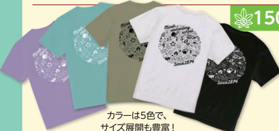
カラーは5色で、サイズ展開も豊富!

記念キャラクターの「かきみん」や箕面大滝など、箕面小&箕面らしいイラストをギュッと凝縮! 体操服としても着用できます。10月12日(土)のイベント当日に販売するので、みんなで記念Tシャツを着て150周年を盛り上げましょう!