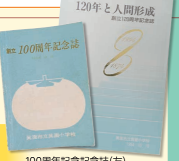
100周年記念冊子(左) 120周年記念冊子(右)

「何度も見たくなるもの」「授業に使えるもの」がテーマ! 地域のかたへの聞き取り学習を行い、子どもたちがまとめた「昔のくらし」についてなど、さまざまな内容を盛り込む予定です。