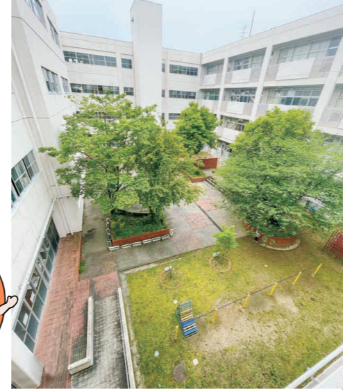
↑植物観察場などに使われている現在の中庭。

から話を聞いた子どもたちは、「光明寺でも給食を作っていたのですか?」など、思い思いに質問を投げかけていました。 この他、中庭の改修(予定)、記念冊子の発行、記念Tシャツの制作など、たくさん企画が進行中です(左記参照)。地域のみなさんの協力のもと、「どうしたら箕面小150周年を多くの人に知ってもらえるか」「どうし