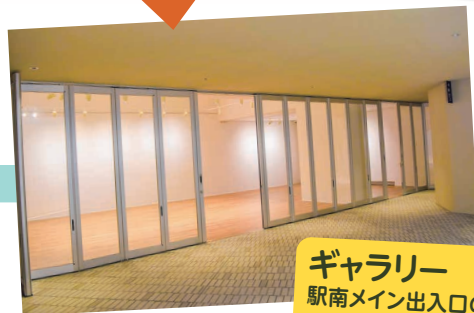
ギャラリー 駅南メイン出入口の改札階にメインギャラリーとオープンギャラリーを設置。