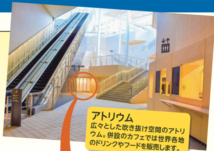
アトリウム 広々とした吹き抜け空間のアトリウム。併設のカフェでは世界各地のドリンクやフードを販売します。

箕面船場阪大前駅の改札階に、市民ギャラリー「チカノバ」がオープンします〔指定管理者は（公財）箕面市国際交流協会〕。ギャラリーのほか、会議室やアトリウム、カフェを併設し、アート作品の展示だけでなく、文化芸能・国際交流に関するさまざまなイベントに活用できます。1日約1万7000人の利用が想定される同駅の改札前にあり、注目度&利便性は抜群！ぜひご利用ください。