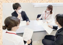
グループワークのようす