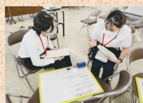
模擬対応の実習のようす

*模擬対応では、学校生活のさまざまな場面(授業前に泣いている子どもがいるなど)を想定して、対応や指導を疑似体験します。