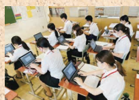
ICT授業の体験のようす