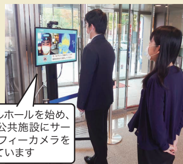
メイプルホールを始め、市内各公共施設にサーモグラフィーカメラを設置しています

そして今年度は、二酸化炭素濃度測定器や、昨年度に引き続きアルコール消毒液などを購入し設置するほか、以下の施設において、トイレ及び空調設備の改修工事を行い、利用者が安全に利用できる環境を整えます。