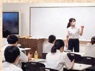
模擬授業の実習のようす