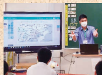
ICT授業の体験のようす