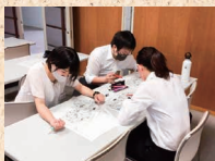
グループワークのようす