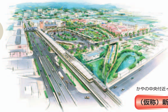
かやの中央付近イメージパース