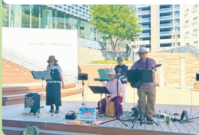
音楽ユニット「まーぶる」