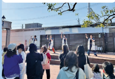
温泉歌謡アイドル「GEN×SEN」