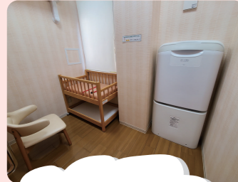
西南生涯学習センターの例