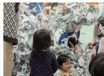
▲あそびのひろば 新聞紙あそび