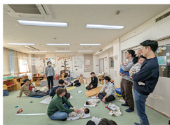
▲パパと一緒に0歳児ひろば