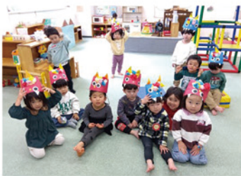
▲生まれ!げんきっこ