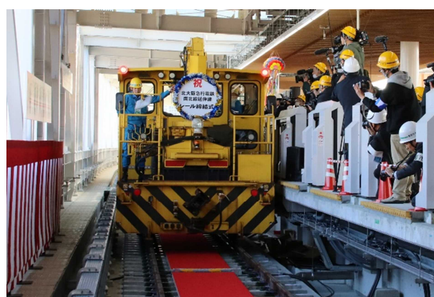
モーターカー発進

【リリース配付先】豊中記者クラブ、青灯クラブ、近畿電鉄記者クラブ、北摂記者クラブ ほか