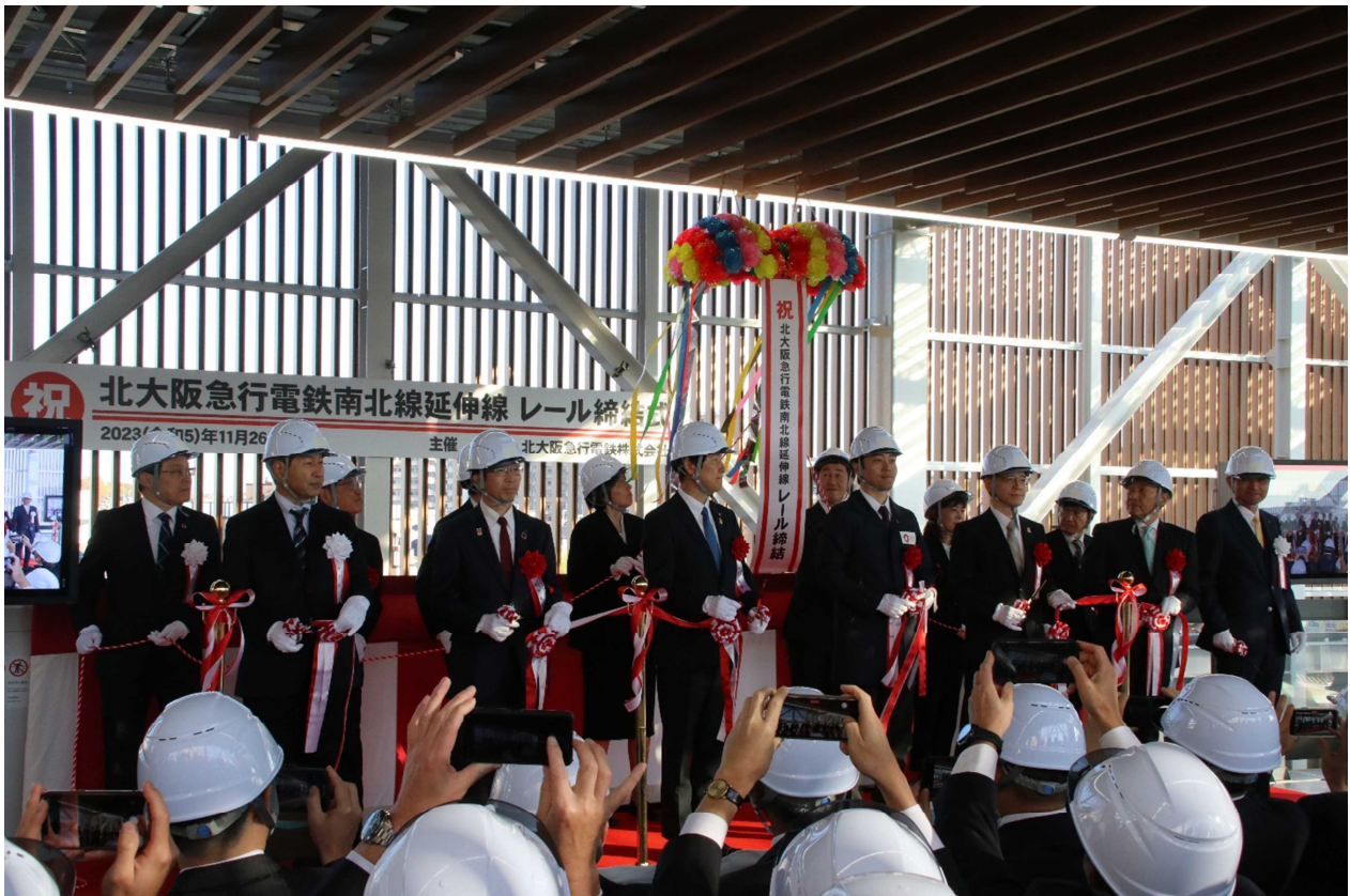
テープカット・くす玉開披

このたび、千里中央駅～箕面萱野駅間のレール敷設工事が完了し、全線のレールが1本につながったことを記念して、さる11月26日（日）に関係者によるレール締結式を箕面萱野駅にて執り行いました。