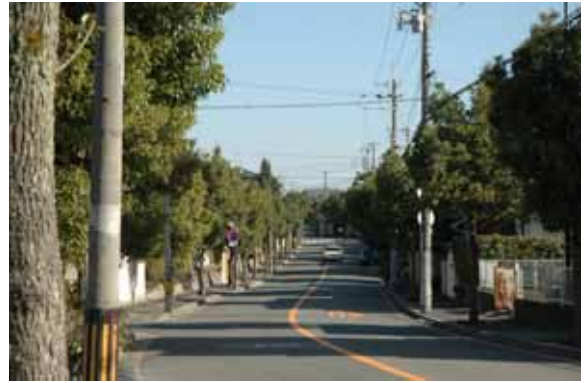
前回調査で人気があった、中央のバス道。並木が美しい。