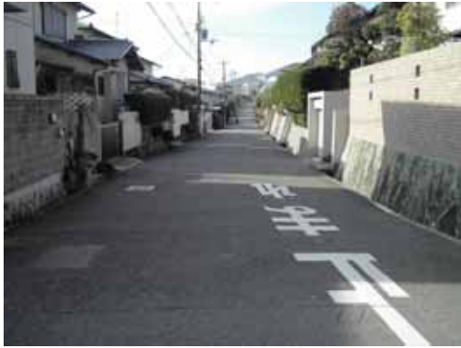
山に向かって坂の道が続く。