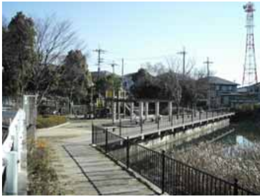
前年度調査で人気があった公園の道