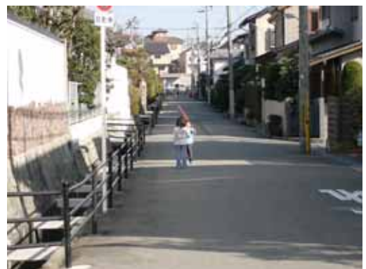
道路で遊ぶ子供たち