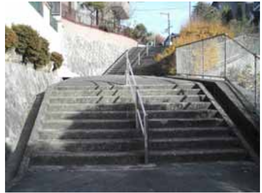
住宅地内には、階段もある。