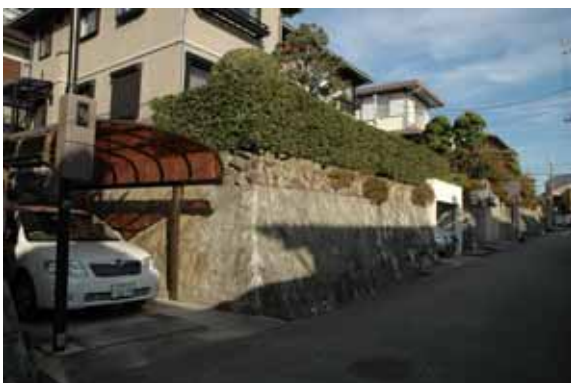
道路から玄関へは、階段を上ってアクセスする