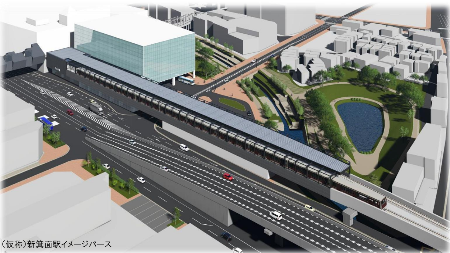
(仮称)新箕面駅イメージパース