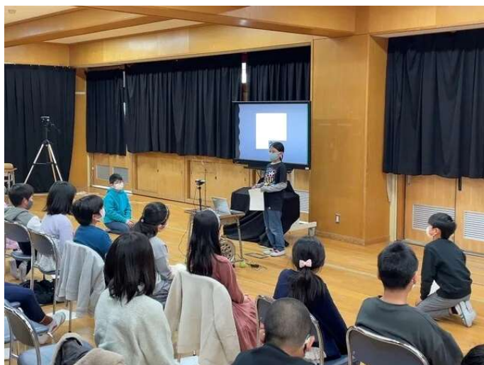
2/18 2分の1成人式(4年オンライン授業参観)