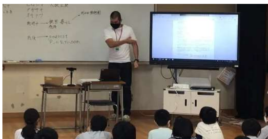
平和学習スタート(6年)