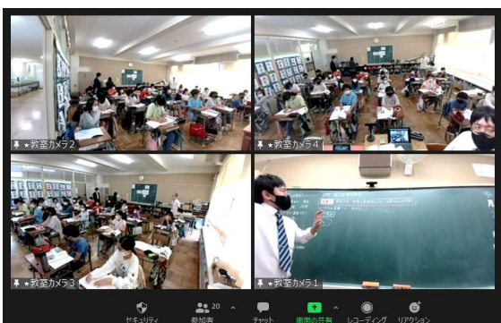
オンライン人権参観(9/24~10/1)