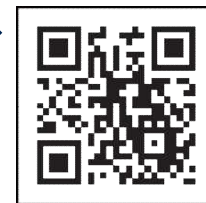
「コロナワクチンナビ」 二次元コード