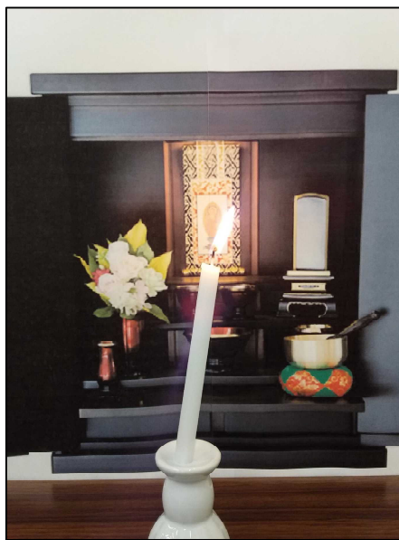
ろうそくが傾いて、倒れる