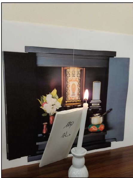
燃えやすい物が倒れる