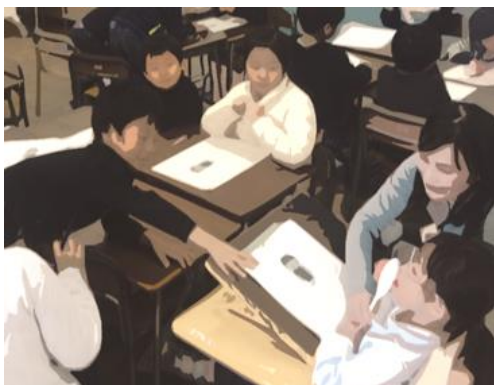
1年 「ねえ おしえて どうしたの?」

変化が著しい社会の中を生き抜き、これからの社会づくりの主体者となる子どもたち。本校では、低学年から紡がれる「あたためあう関係」の中で、自ら課題を見つけ、見つけた課題を仲間とともに解決できたという経験を積み上げていくことが、それぞれの進路を切り拓き、よりよい社会の実現に向けて具体的に行動する力を高めていくことにつながると考えています。「仲間」とつながり、ともに課題を解決し、そして「未来」とつながろうとする子どもたちが、各々のもちあじを生かし、多様な考え方にふれていきながら学びを深めていく様子を授業公開します。