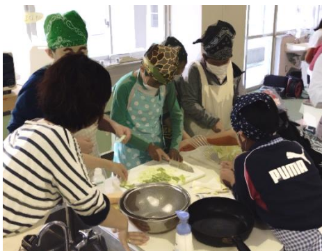
5年 地域の方々と「食」を通じた出会い