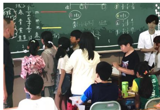
6年 仲間と力を合わせて応用問題に挑戦しよう