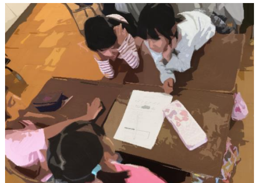
2年 「わたしたちの安心ルール」をつくろう