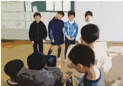
3年 CMづくりにチャレンジしよう