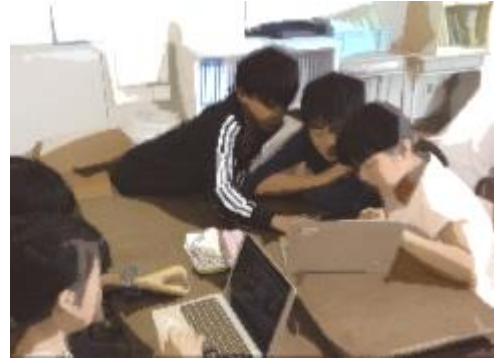
4年 タブレットを使ってイイサーを教えあおう