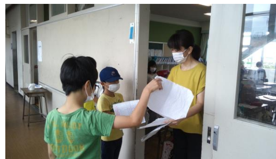
登校前検温と体調チェック

朝、教室の前で健康観察カードを出してから教室に入ります。忘れてきた人は検温場所へ行き、検温と体調チェックを受けます。