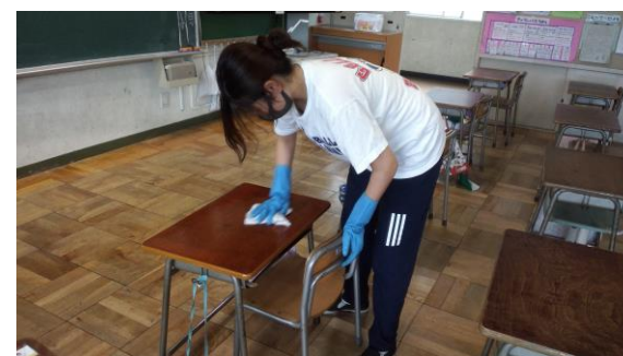
教室や共用物の消毒