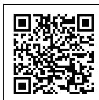
市ホームページ QRコード